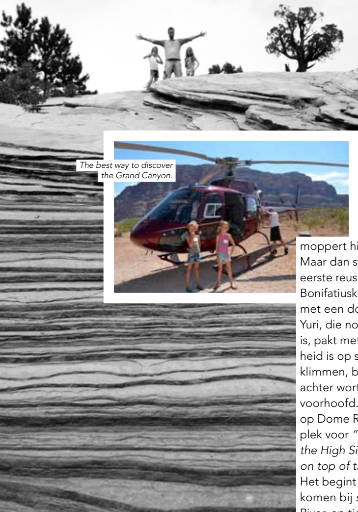
The best way to discover the Grand Canyon.