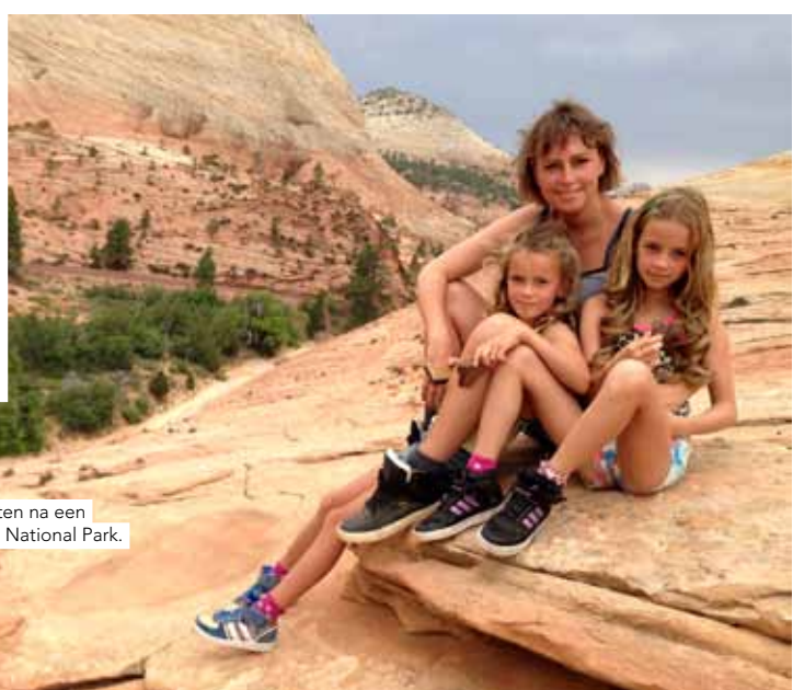
Even uitrusten na een klim in Zion National Park.