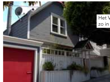
Het Victoriaanse huis kan zo in een woontijdschrift.