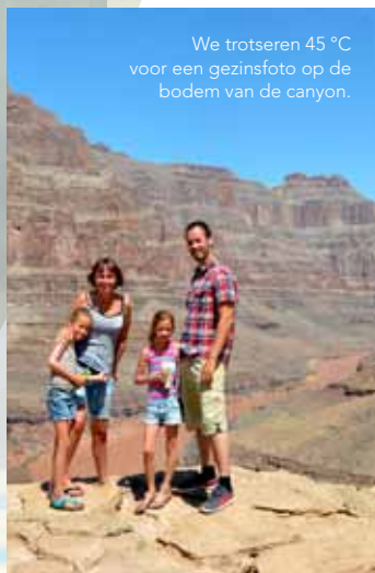
We trotseren 45 °C voor een gezinsfoto op de bodem van de canyon.