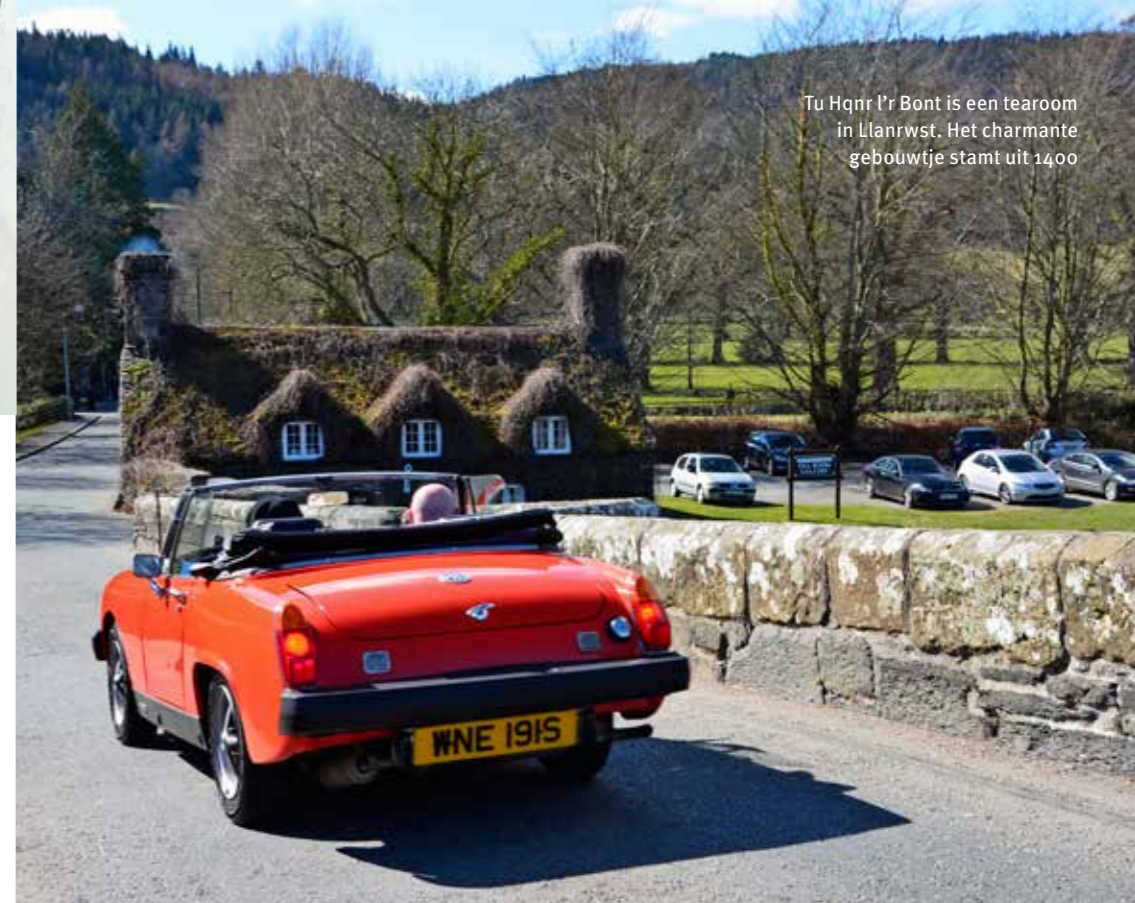
Tu Hqnr l'r Bont is een tearoom in Llanrwst. Het charmante gebouwtje stamt uit 1400