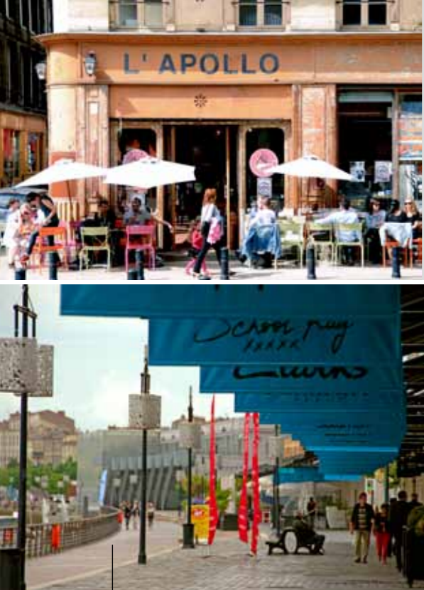
Hangars des Quais, designer-outlet voor luxe kledingmerken en woonspullen