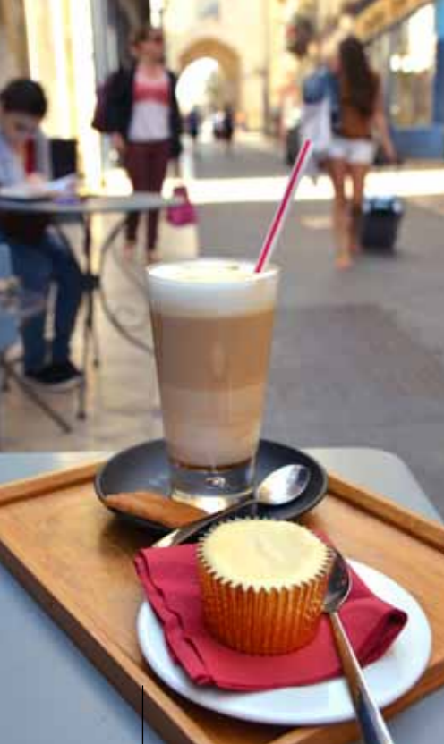
Books & Coffee