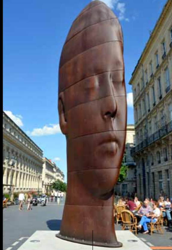
Place de la Comédie